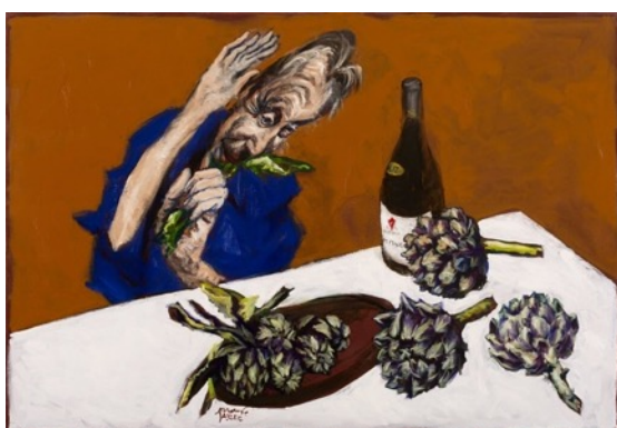
Gérard Garouste, Festin, 2018. Huile sur toile, 89 x 130 cm.

À l'occasion du projet Table Square , nouveau lieu dédié à la gastronomie qui verra le jour courant septembre 2019, le promoteur immobilier Urban Renaissance invite l'association La Source à exposer, du 12 février au 31 août 2019 sur l'esplanade de Paris La Défense, 32 artistes plasticiens de différentes générations parmi les plus importants de la scène française. Chacun a été invité à interpréter à sa guise l'art de la Table : le goût, les saveurs, la cuisine, les plats, ou encore des histoires ou des mythes parlant de celui-ci, thèmes chers à notre pays.