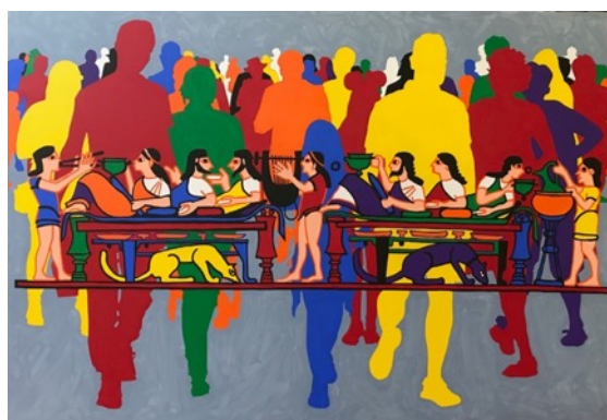
Gérard Fromanger, Festin, Paris-Ferrento-Paris , série Allegro , 2018. Acrylique sur toile, 130 x 89 cm.